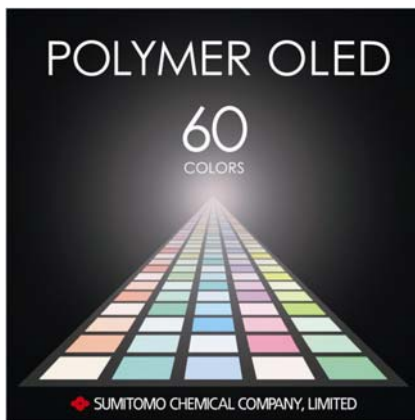
出展内容をイメージして制作したキービジュアル

住友化学株式会社は、2012年4月、ドイツ フランクフルトで開催される世界最大級の照明・建築技術見本市「Light + Building (ライト・アンド・ビルディング) 2012」に、高分子有機 EL 照明を初出展いたします。